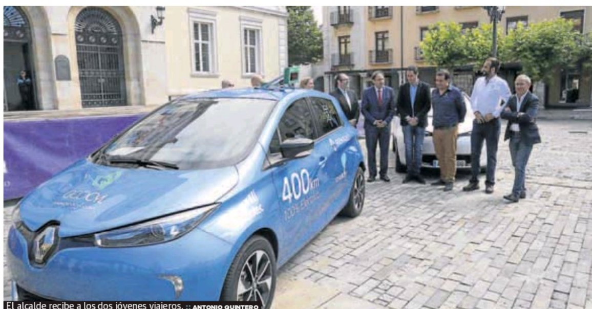
El alcalde recibe a los dos jóvenes viajeros.

Todas las rutas son gratuitas y para participar en ellas es imprescindible inscribirse en la Oficina de Turismo de la Calle Mayor o en el teléfono 979 706 523, ya que el número de plazas está limitada a 50 personas, excepto la de Victorio Macho que contará con 32 máximo. En el año 2016, la participación en las Rutas de la Luz fue de 1.449 personas, según la información facilitada ayer por el Ayuntamiento, que anunció que comenzarán este sábado.